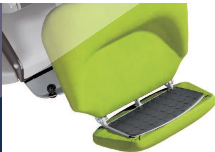
Pedana a scomparsa Footboard retractable